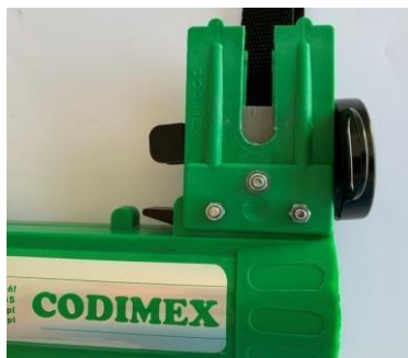
Zamocowana tuszownica, widok z boku